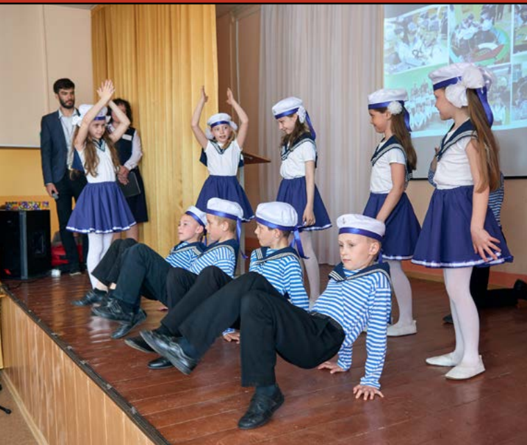
МОУ «Колтушская СОШ им. ак. И. П. Павлова»