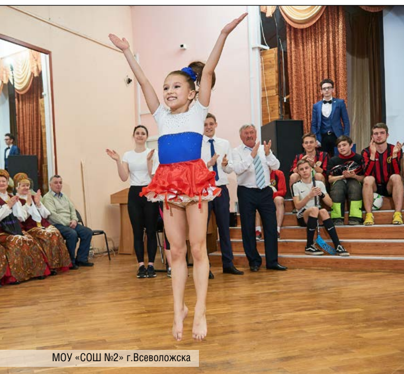
МОУ «СОШ №2» г. Всеволожска

Участники заключительного тура конкурса – диплом финалиста, участники I тура – сертификат участника.