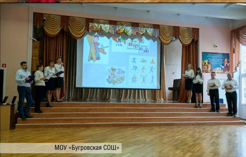
МОУ «Бугровская СОШ»