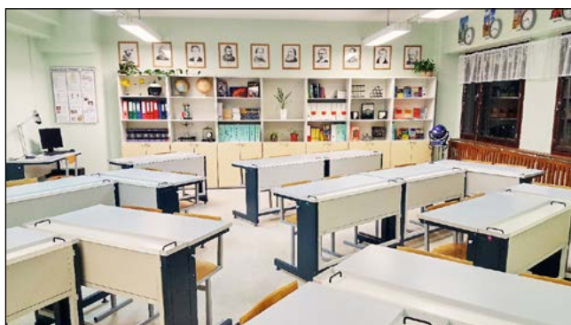
МОБУ «СОШ «Агалатовский центр образования»