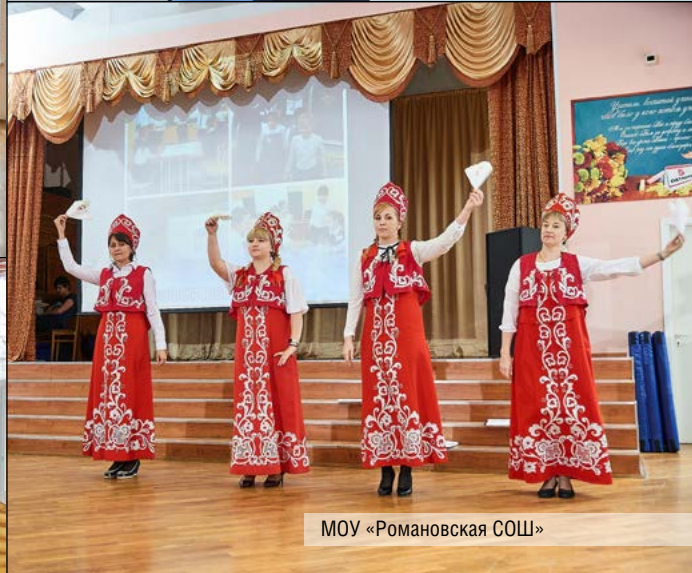
МОУ «Романовская СОШ»