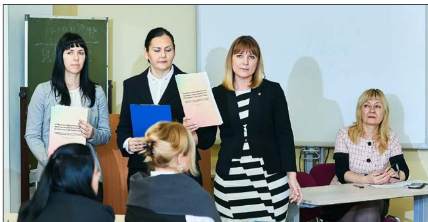
Коллектив авторов «ДСКВ №35» п. Бугры, «Агалатовский ДСКВ №1», «Кузьмоловский ДСКВ»