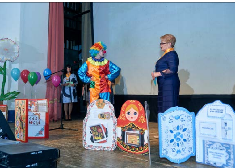
МДОБУ «Чернореченский ДСКВ»