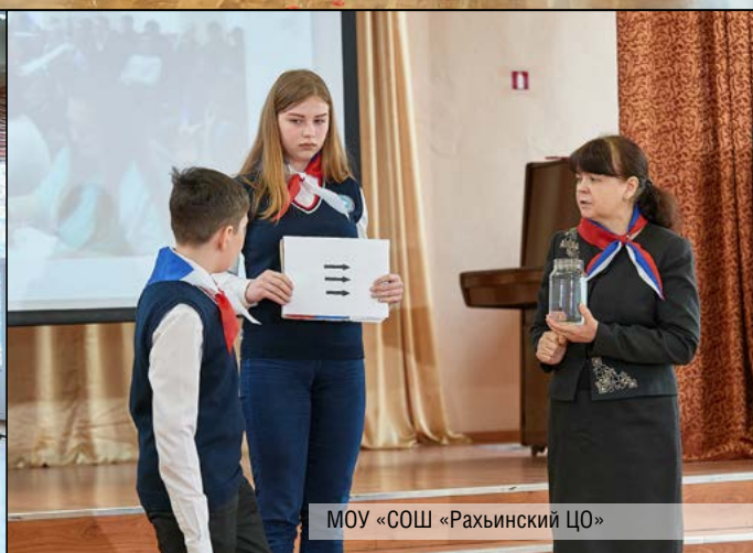
МОУ «СОШ «Рахынский ЦО»