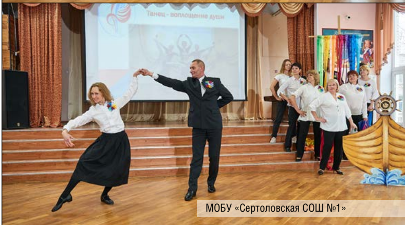
МОБУ «Сертоловская СОШ №1»