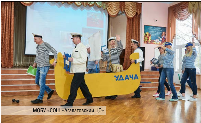
МОБУ «СОШ «Агалатовский ЦО»

ШКОЛЬНОЕ МЕТОДИЧЕСКОЕ ОБЪЕДИНЕНИЕ УЧИТЕЛЕЙ ИНОСТРАННЫХ ЯЗЫКОВ МОУ «СОШ «СВЕРДЛОВСКИЙ ЦО»