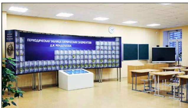
МОБУ «СОШ «Муринский центр образования №1»