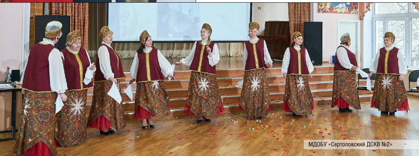
МДОБУ «Сертоловский ДСКВ №2»

ШКОЛЬНОЕ МЕТОДИЧЕСКОЕ ОБЪЕДИНЕНИЕ УЧИТЕЛЕЙ ФИЗИЧЕСКОЙ КУЛЬТУРЫ, ТЕХНОЛОГИИ И ОБЖ МОУ «БУГРОВСКАЯ СОШ»