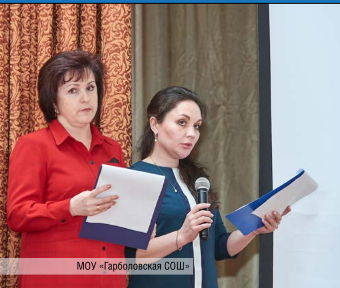
МОУ «Гарболовская СОШ»