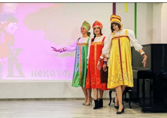
Команда молодых педагогов Всеволожского района

Лауреат областного конкурса «Библиотекарь года – 2018»