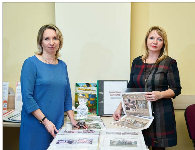
Коллектив МДОУ «ДСКВ №12» п. Романовка

педагог дополнительного образования, художественный руководитель Образцового детского коллектива театральной студии «Люди и куклы» МБОУДО «Дворец детского (юношеского) творчества Всеволожского района»