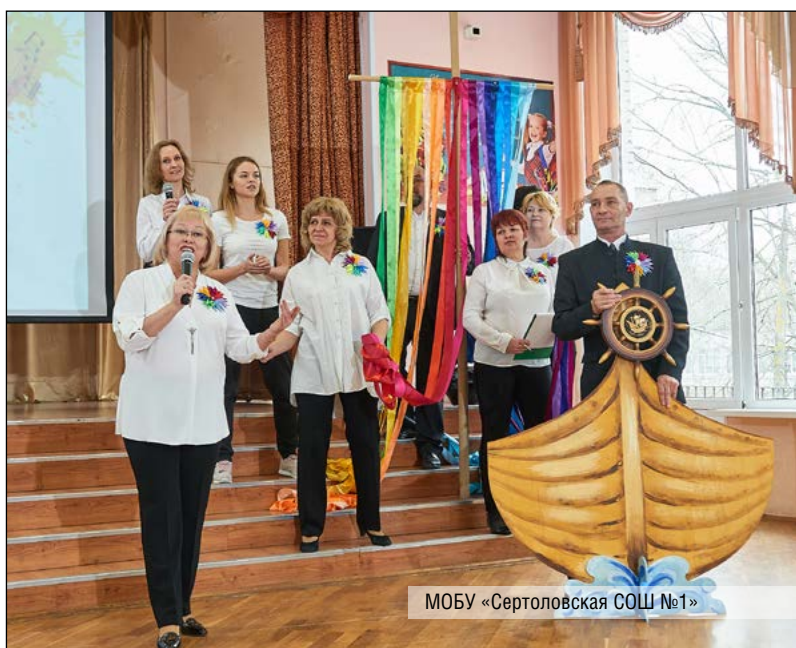
МОБУ «Сертоловская СОШ №1»

Школьное методическое объединение классных руководителей МОУ «Дубровская СОШ»