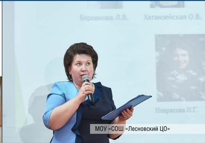
МОУ «СОШ «Лесновский ЦО»