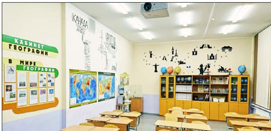
МОБУ «СОШ «Кудровский центр образования №1»