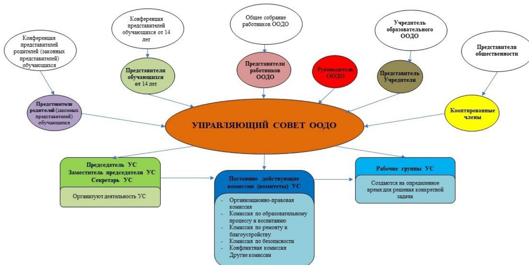
Рис. 2. Модель № 2 – «Управляющий совет образовательной организации дополнительного образования» (УС ООДО)